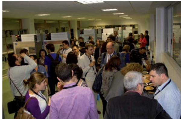
Foto 9. La sesión de pósters, todo un éxito