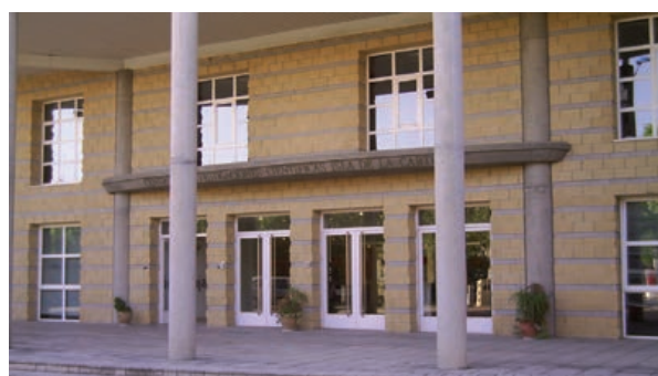
Vista parcial del edificio del cicCartuja donde está integrado el ICMS.

Después de las charlas, los alumnos y profesores participantes de los centros educativos realizaron visitas concertadas al ICMS, al IIQ y al IBVF. Con antelación, a todos ellos se les proyectó un vídeo divulgativo que muestra las distintas actividades en Ciencia y Tecnología que vienen desarrollando los tres Institutos mixtos que integran el Centro. Asimismo, se presentó una nueva edición de los Cuadernos de Divulgación