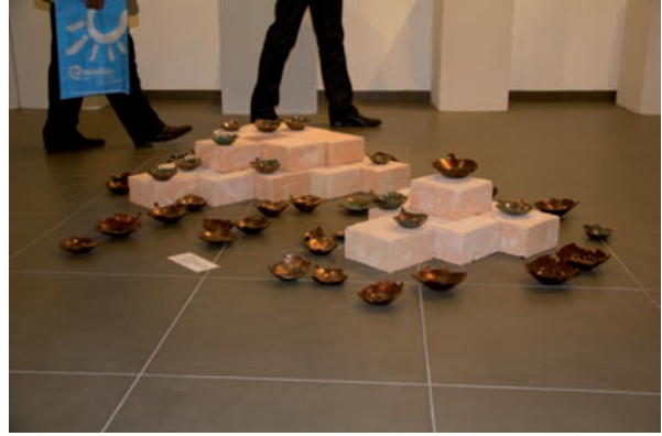
Foto 5. Una de las obras de alumnos de la ESCAL expuestas.