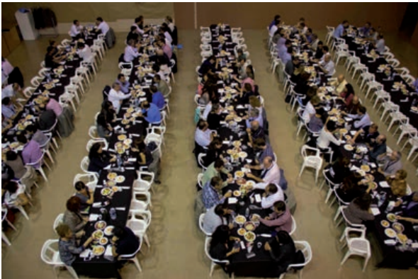
Foto 6. Almuerzo de trabajo.