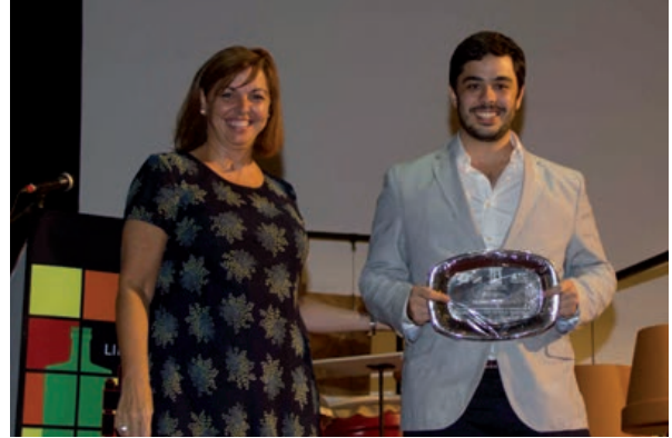
Foto 13. Premio de póster.