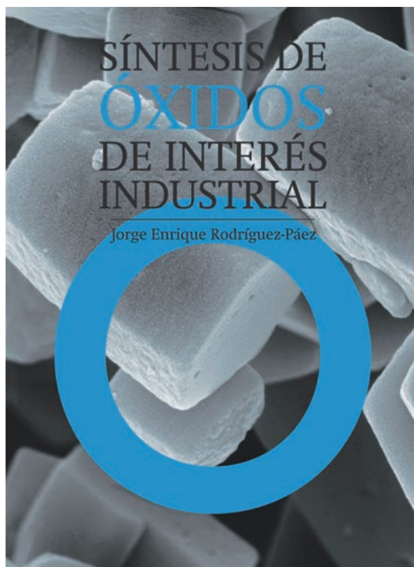
Portada del libro.

Sin embargo, al igual que ocurre en otros campos, la producción en español es muy limitada, dada la menor facilidad de difusión de textos fuera de la lengua inglesa, claramente reconocida como la lengua científica internacional. Por lo tanto, la llegada de una obra de estas características es una excelente noticia para los científicos y técnicos del mundo hispano-parlante, ya que es una de las escasas contribuciones de calidad en nuestro idioma que recogen las inquietudes y experiencia del autor en la síntesis de óxidos, además de ofrecer la información necesaria para que tanto el lector novel como el más avezado, pueda entender no solo las propiedades estructurales de los óxidos, sino también correlacionarlas con su síntesis, proporcionando las herramientas clave para el diseño y control de óxidos de las propiedades deseadas.