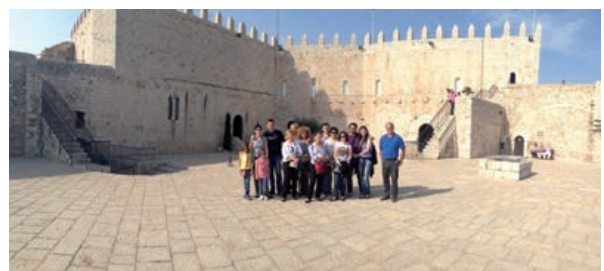
Foto 19. Visita a Peñíscola.