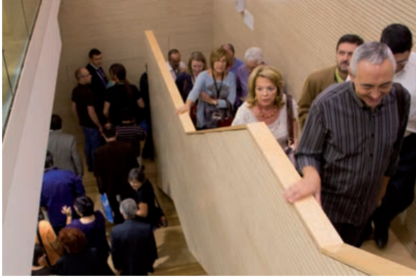
Foto 4. Recepción del Ayuntamiento de L'Alcora en el Museo de Cerámica.