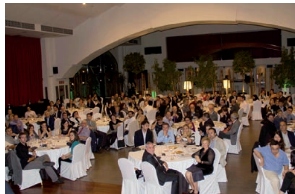
Foto 11. Imagen de la Cena de Gala