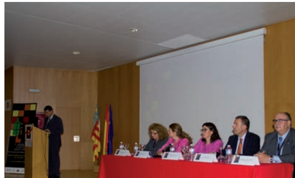
Foto 1. Inauguración del Congreso.

Bajo este lema, se pretendió organizar y vertebrar el Congreso. Una muestra de ello, fue la sesión dedicada a la presentación de los diferentes grupos de investigación