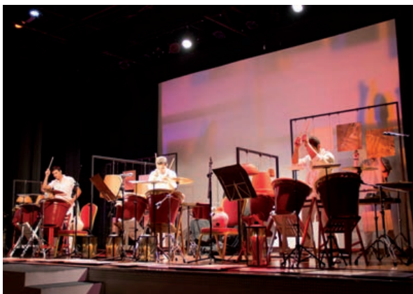
Foto 18. Momento del espectáculo musical.