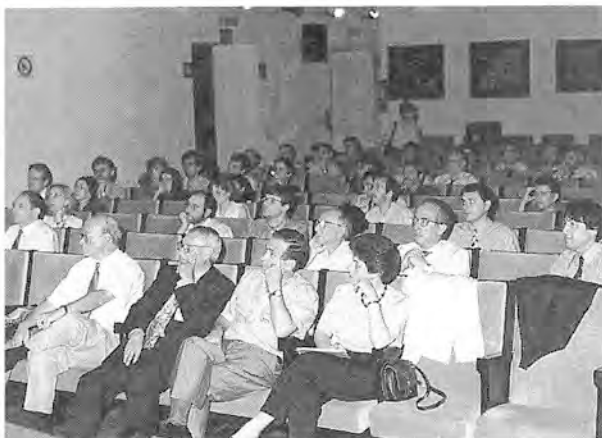
Vista general del salón donde se celebraron las distintas sesiones orales.