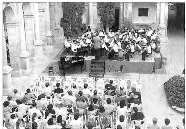
Concierto a cargo de la Orquesta Joven del Conservatorio de Música de Alcalá de Henares, celebrado en el claustro del Rectorado de la Universidad.

sector. Se constató que mientras los grupos de investigación se muestran abiertos y receptivos a la posibilidad de desarrollar investigaciones para la industria nacional, los grupos industriales buscan nuevos desarrollos en grupos de investigación extranjeros, preferiblemente europeos.