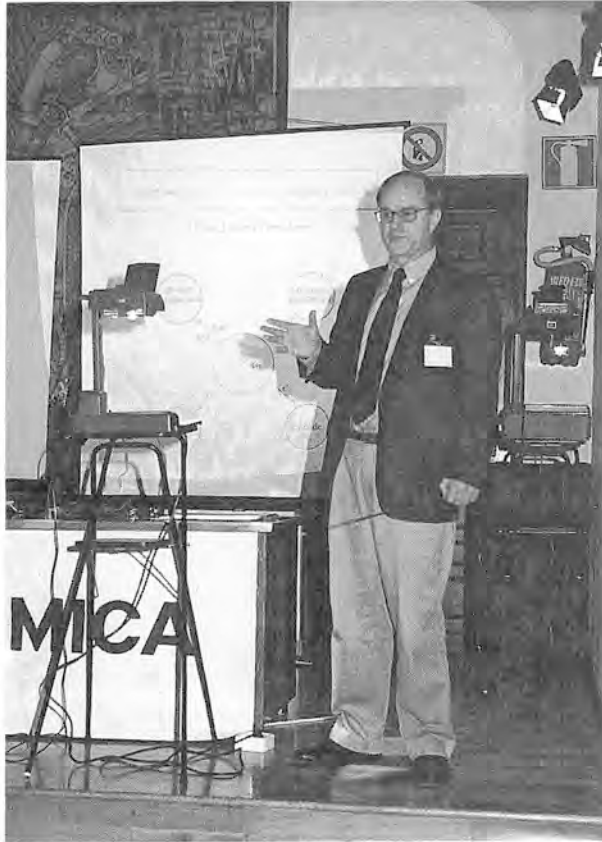
El Prof. Jacques Livage, Université Pierre et Madame Curie, Paris, France, durante un momento de su conferencia inaugural sobre: Propiedades ópticas y eléctricas de laminas delgadas de óxidos depositadas por sol-gel. En su conferencia realizó una excelente revisión sobre el estado del arte en este campo, aportó datos recientes sobre aplicaciones en desarrollo y estableció los parámetros directores en el futuro de este tipo de materiales.