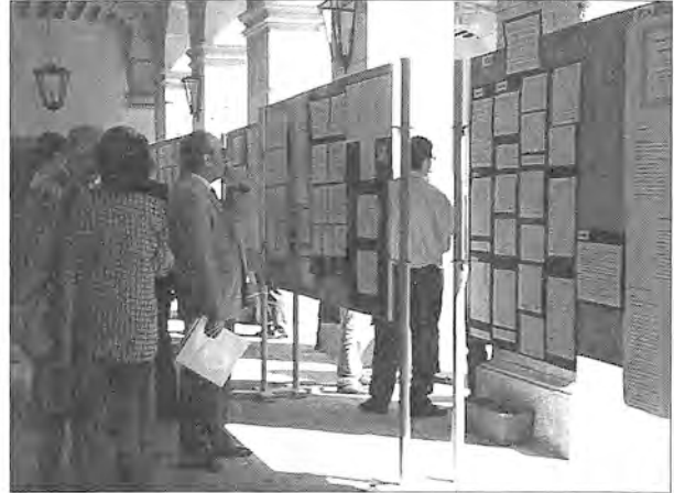
Vista general de la sesión de Poster.